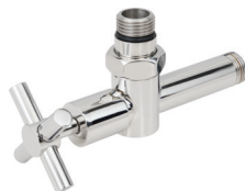
Вентиль запорный (крестовой) G 1/2" НР x 1/2" НР арт. 01002-1212