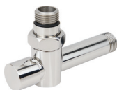
Вентиль запорный (скрытый) G 1/2" НР x 1/2" НР арт. 01001-1212