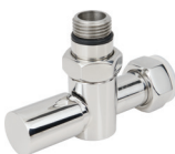
Вентиль запорный (круглый) G 1/2" НР x 3/4" НГ арт. 01000-1234