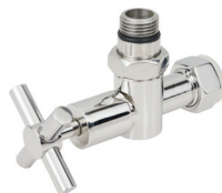
Вентиль запорный (крестовой) G 1/2" НР x 3/4" НГ арт. 01002-1234