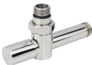
Вентиль запорный (круглый) G 1/2" НР x 1/2" НР арт. 01000-1212