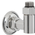
Набор комплектующих для PC G 1/2" НР x G 3/4" НГ арт. 03002-1234