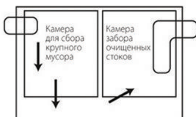
Вариант жиросъемщика с дополнительной камерой для сбора крупного мусора